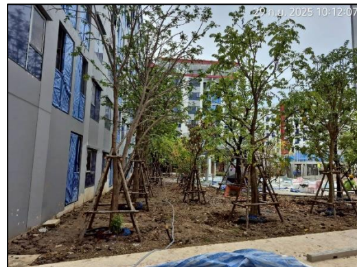
ภาพที่ 1.6-1 สถานภาพโครงการในปัจจุบัน